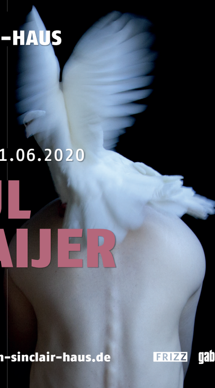
Juul Kraijer, Untitled photograph, 2016–2019 © Juul Kraijer